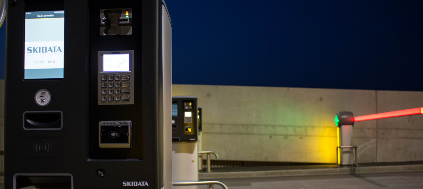
06 Samostalan čitač kreditnih kartica za naplatu parkiranja na izlaznim terminalima